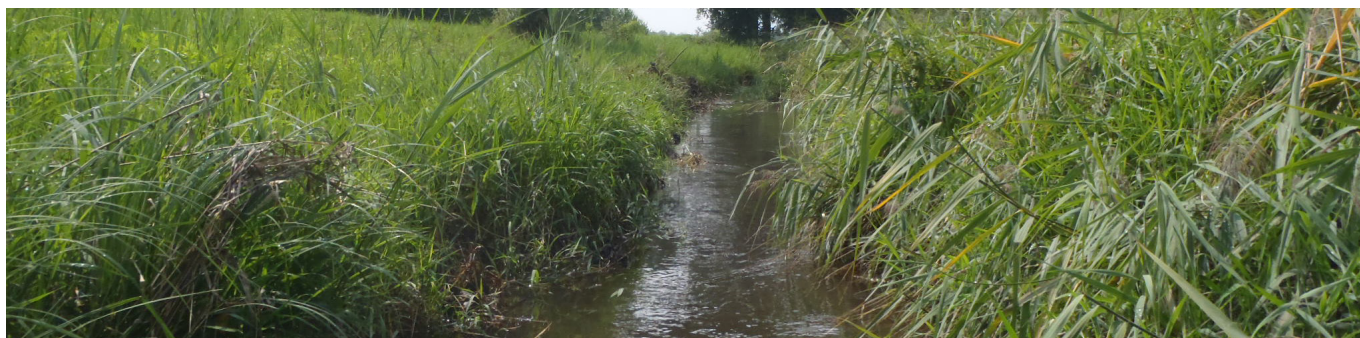
Zapfenbach kurz vor der Mündung in den Rheintaler Binnenkanal