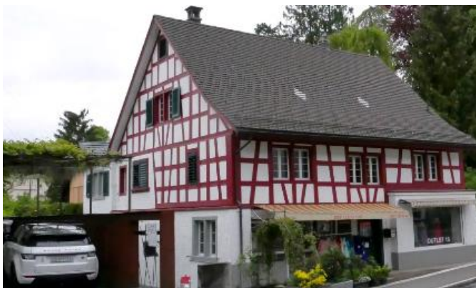
Fernwirkung von Dorfstrasse Foto: 2019, Stephan Eitner

Die Kleinformatigkeit und schuppenartige Montage in der Dachfläche nimmt die horizontale Verlegungsart von herkömmlichen Ziegeldächern auf. Die schwarzen Module können mit diversen Tonziegelfarben kombiniert werden. Nahtloses Ineinandergreifen von Modulen und Ziegeln. Foto: 2019, Stephan Eitner